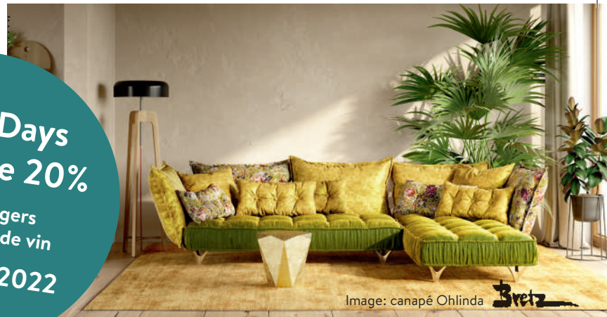
Image: canapé Ohlinda