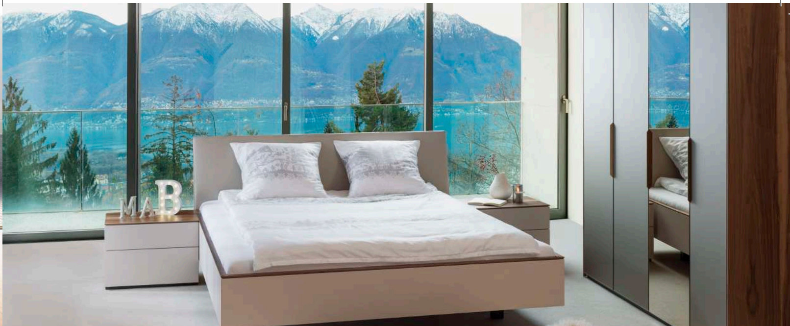
Image : chambre à coucher LUNA MAB Möbel Muotathal